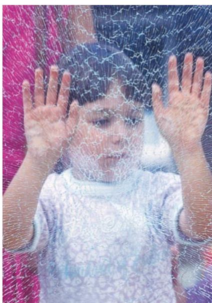
Doc. Saint Gobain Glass. Vetro Stadip, classe di resistenza 2(B)2.

Quando invece ci si confronta con la sicurezza, in caso di materiale non conforme a quello previsto dalla normativa e, in presenza