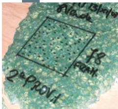
Fig. 1 - Rottura di una lastra da 4 mm in tanti piccoli pezzi inoffensivi.