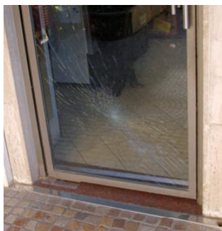
Fig. 4 - La rottura vista dall'interno.